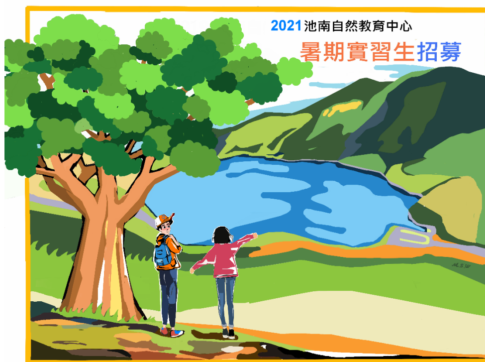
走入洄瀾時光森林，體驗低海拔山水之美，實踐友善環境生活

花蓮林區管理處為促進池南自然教育中心與大學院校學術機構合作，開創青年學子一個嶄新的學習環境，藉由理論與實務結合之培訓課程，提供學生參與環境教育及志願服務管道，以培育未來環境教育專業從業人員為目標，特訂定本計畫